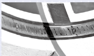
▲凹型の目盛りには刻まれた数字に、手前の銀の棒の影が落ちて時を示します