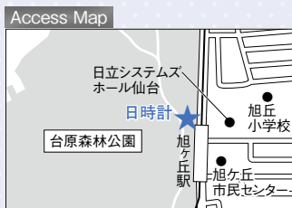
地下鉄旭ヶ丘駅から徒歩2分