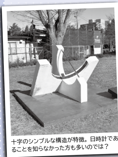
十字のシンプルな構造が特徴。日時計であることを知らなかった方も多いのでは？