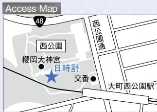
地下鉄大町西公園駅から徒歩4分