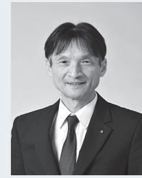
泉区長 遠藤 弘一

泉区は、泉ヶ岳に代表されるように、豊かな自然環境に恵まれ、泉中央地区を中心に文化・商業施設も集まるなど、多様な魅力を併せ持ったまちです。地域の皆さまをはじめ、さまざまな地域団体と連携して、その魅力を発信していくとともに、より一層地域間交流を促進させることで、活力と潤いあふれるまちづくりを進めてまいります。 現在、令和8年度の供用開始に向けて工事を進めている区役所庁舎建替事業では、ユニバーサルデザインや、業務のDX化