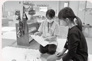
▲のびすく子育てコーディネーター「NoKoCo(のここ)」が相談に応じます