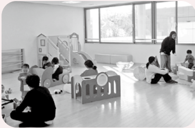
▲さまざまな種類の遊具や絵本などがあり、親子で楽しめる環境が充実しています

乳幼児がいる家族みんなの交流の場です。遊具を使って自由に遊べる遊び場や飲食スペース、授乳室などがあります。また、お誕生会やお話会、離乳食やトイレトレーニングをテーマにした講座など、さまざまなイベントを毎月開催!