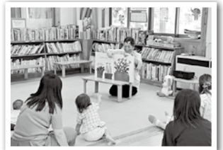
▲大きな絵本で読み聞かせ

各児童館では、手遊びや体操、読み聞かせなど、みんなで楽しめる定例行事も行われています。季節に応じた遊びや、親子同士が交流できるサロンもありますので、お気軽にご参加ください♪