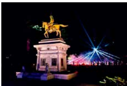
新たなイルミネーションイベントの創出などにより、滞在期間の延長を図り、宿泊客数の増加につなげます

1億5144万円 本市にゆかりのある漫画やアニメを活用して、本市の認知度の拡大を図ります。