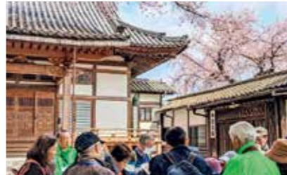
歩きながら区内の歴史や文化に触れ、地域の魅力を体験できる「若林わくドキまち歩き」

区民協働まちづくり事業 「若林区民ふるさとまつり」や「若林わくドキまち歩き」、「ラヂオはいらいん若林」など、区の特徴を生かし、地域の魅力発信に取り組みます。また、地域の課題解決や活性化のため、公募により市民団体が自主的に取り組みまちづくり活動への助成を行います。