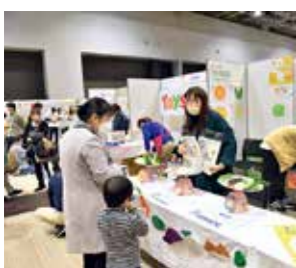
子育てや健康に役立つ情報の紹介や、親子で楽しめるワークショップなどを行う「みんな子育てフェスタ&健康フォーラム」

児童生徒一人一人に合った教育活動ができるよう、部活動の地域移行や学校版BPRに取り組むほか、教職員向けの巡回型カウンセ