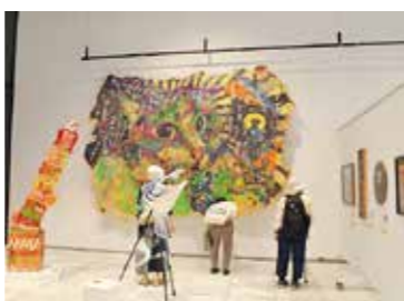
障害のある方の芸術活動の普及と振興を目的とした作品展の開催などにより、障害理解の促進を図ります

共生社会の実現に向け、障害理解や社会参加の促進、就労支援など、各種施策に取り組みます。医療的ケア児や重症心身障害児などへの支援を充実させるため、受け入れ施設の開設費補助を拡充するほか、医療的ケアが必要な方を