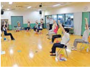
身体機能の改善や運動の習慣化のための教室数を拡大するなど、介護・フレイル予防の取り組みを推進します

ボランティアや介護・フレイル予防などの活動に応じて市内の店舗での買い物などに使用可能なポイントを付与するアクティブシニア・ボランティアポイント制度を実施し、高齢者の社会参加や健康寿命の延伸を後押しします。介護予防や生活支援サービスの提供のほか、介護予防活動を行うサポートの育成、地域の介護予防自主グループの活動支援などに取り組めます。