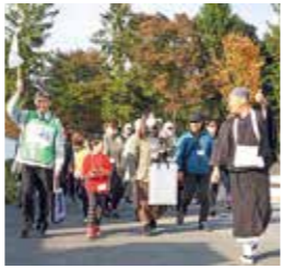
大町や西公園の周辺をまち歩きする「親子で楽しむ宝さがしツアー」

未来につながる地域力推進事業 地域に向いて町内会を支援する「出前まちづくりサポートセンター」事業やマンションコミュニティ強化、学生の参加による地域づくり推進、作並・新川地区活性化、仙台萬本さくらプロジェクトなどに取り組みます。また、先端技術などを活用し、少子高齢化などが進む宮城地区西部における地域課題の解決に取り組みます。