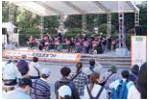
「青葉区民まつり」では会場内各ステージで、地域で活動する団体による多彩な演奏などが繰り広げられ、お祭りを盛り上げます

区民協働まちづくり事業 「青葉区民まつり」や「宮城地区まつり」などを開催するほか、区民主体の各種イベントを支援します。また、地域の課題解決や活性化などの活動への助成を行います。