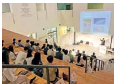
起業への関心が高い仙台・東北の若者を対象に、グローバルに活躍する人材を育成するプログラムを実施します

4億7521万円 仙台・東北からスタートアップを連続的に生み出す「スタートアップ・エコシステム」のグローバル