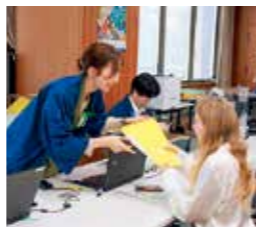
戸籍住民課窓口における多言語対応を強化するなど、外国人が暮らしやすい環境の整備に取り組みます

◆ 先人が培ってきた仙台の歴史、文化を誇りとし、多様な人の力を掛け合わせながら、彩り豊かな仙台の未来につなげてまいります。