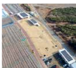
東部沿岸エリアの民間施設に太陽光パネルを設置するなど、脱炭素先行地域づくりを進めています

開園150周年を迎える西公園記念事業を実施するとともに、海浜エリアでは周遊イベントを開催します。長町地区における歩いて楽しい街並み形成や、泉区役所建て替えを契機とした泉中央地区の活性化についても検討を進めます。