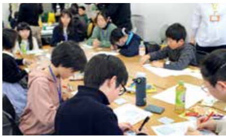
仙台ごとこも財団が主催する「ごとこも・若者会議」では、子どもたちや若者が参画して意見交換などを重ね、企画の立案や提案の実現に向けた取り組みを行います

1億3743万円 子どもの権利について、児童や保護者に向けた啓発を行うとともに、子どもの意見を聞き取る手法や各施策への反映方法などについて、職員を対象に研修を行います。また、仙台ごとこも財団と連携しながら、子どもたちが市の施策などに対して意見を伝え、政策を決めるプロセスに主体的に参加できる「ごとこもいけん広場」を実施するなど、子どもと若者の最善の利益の実現に向けた取り組みを進めます。