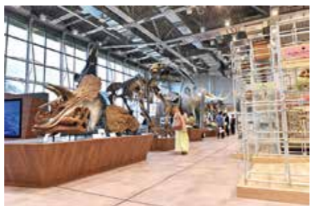
令和6年度にリニューアルした科学館4階展示室。4月には3階展示室「生活と科学」がリニューアルオープンします

2260万円 子どもたちの健やかな成長を支えるため、令和8年4月より子ども医療費助成の対象を15歳到達年度末までから18歳到達年度末までに拡大するとともに、5000円の利用者一部負担金を廃止するため、システムの改修などを行います。