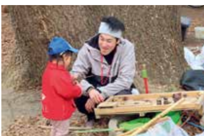
プレーリーダーや地域の大人などの見守りの中で、子どもたちが自由な遊びを実現できるプレーパークの活動を支援します

557億3428万円 困難を抱える家庭の小学生が安心して過ごせる居場所を拡充した上で、基本的な生活習慣の習得などを目的とした支援を行います。また、セミナーの開催などにより自由な遊びを実現する場づくりへの理解を深め、プレーリーダーの育成を図るなど、子どもたちが安心して自分らしく育つ環境づくりに向けた取り組みを進めます。