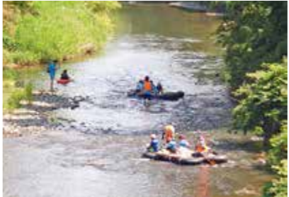
「七北田川クリーン運動（自然観察会）」でのいかだ下りの様子

区民協働まちづくり事業 「泉区民ふるさとまつり」や「七北田川クリーン運動」、「泉ヶ岳悠・遊フェスティバル」などのイベントを開催します。また、大学生による地域づくり活動や高校生主体の安全安心まちづくり活動を支援するほか、公募により区民の皆さんが自主的に取り組みまちづくり活動への助成を行います。