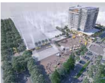
新本庁舎の低層部と周辺エリアとの一体的利活用に向けて、検討を進めています

142億2725万円 市内中心部の日常的なにぎわいや交流を創出するため、市役所本庁舎建て替えなどの事業と連携しながら勾当台公園および定禅寺通を含む周辺道路の再整備を行うほか、公民連携によるまちづくりを進めます。