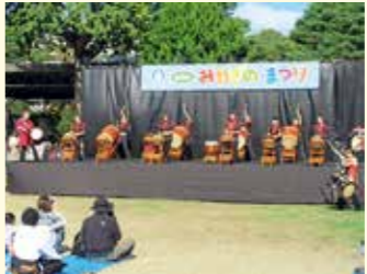
ステージ発表や露店、ブース展示など、区民主体で開催する「みやぎの・まつり」

区民協働まちづくり事業 「みやぎの・まつり」の開催や「宮城野盆唄」の普及をはじめ、子育て支援、防災、地域の魅力発信などに取り組みむほか、公募によるまちづくり活動への助成を行います。また、次代のまちづくりを担う若手人材の育成を目的としたセミナーなどを開催し、地域との交流を深め、ネットワークづくりを促進します。