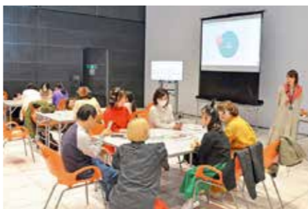
ダイバーシティについて知り、多様性を体感できるイベントを開催します

本市のさまざまな施策を検討・実施する際に盛り込むべきダイバーシティの視点などを取りまとめた「仙台市ダイバーシティ推進指針」に基づき、誰もが安心して住み続け、活躍できるまちづくりを進めます。ダイバーシティへの理解促進やダイバーシティまちづくりに向けた機運を醸成するため、市民参加型のイベントを開催します。また、災害リスクなどの情報の読み上げに多言語で対応したスマートフォンアプリを導入するなど、デジタル技術も活用しながら、