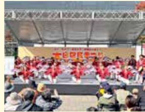
地域団体などが出演し、歌や演奏、ダンスなどが披露される「太白区民まつり」のステージ

区民協働まちづくり事業 「太白区民まつり」や「まつりだ秋保」を開催するほか、大卒との協働により、若者のまちづくり活動への参加を支援します。また、公募により市民団体が取り組みまちづくり事業への助成を行うなど、地域づくり活動を支援します。