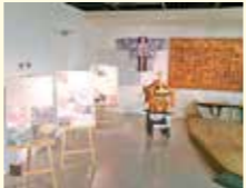
震災伝承施設「蒲生なかの郷愁館」において企画展などを開催します

未来につながる地域力推進事業 多様な主体の連携による地域づくり活動などを進めるため、情報共有・課題検討を行う勉強会や実践につながるワークショップの開催などを支援します。 海浜エリア活性化事業 二次交通の実証運行や、海浜エリア全体の周遊を促進するイベントの実施により、域内の回遊性向上を図るとともに、未来を担う世代に向けた震災伝承の取り組みなどを、地域や事業者と連携しながら進めます。