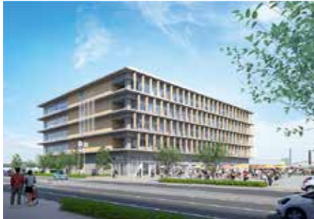
南東側から見た泉区役所新庁舎のイメージ