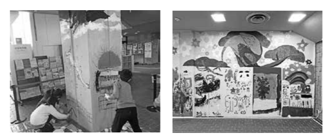
問泉区総務課 ☎372・3111 (内線6118)

壁面アートイベントを開催しました 泉区役所が建て替え・移転という節目を迎えるに当たり、1月6日に、現庁舎内の壁面に絵を描く「壁面アートイベント『みんなで描こう!ウォールアート』」を開催しました。