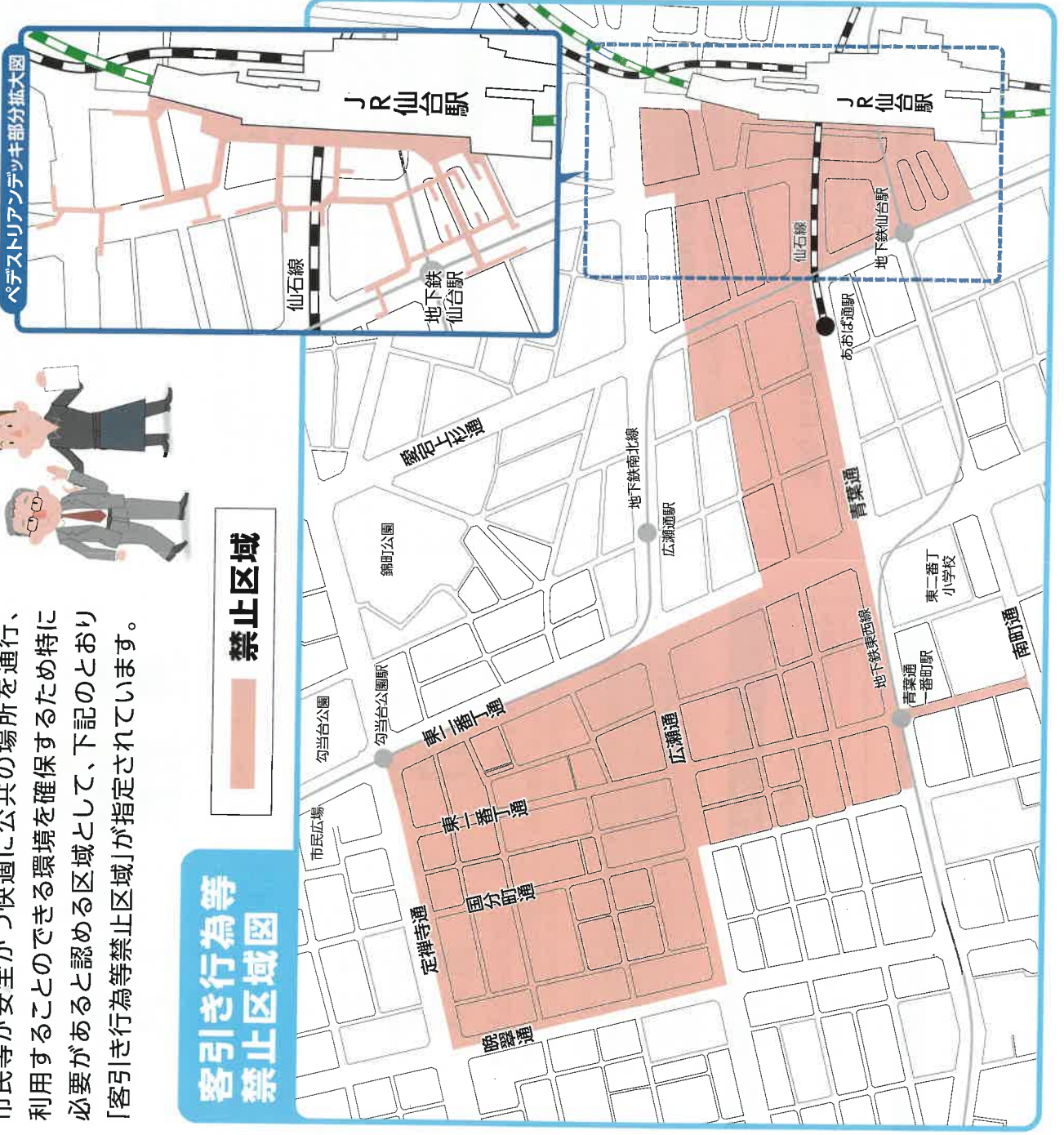
ペDESTリアンデッキ部分拡大図