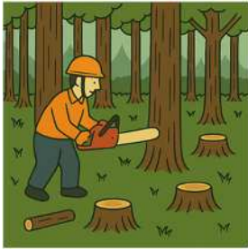
保育間伐・搬出間伐