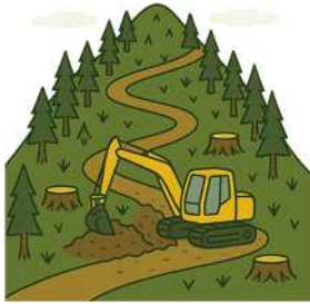
間伐等に伴う 作業道整備・枝打ち