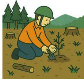
地拵え・苗木購入・植林