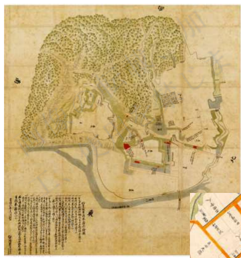
仙台城修復伺絵図 享保6年(1721) 仙台市博物館所蔵