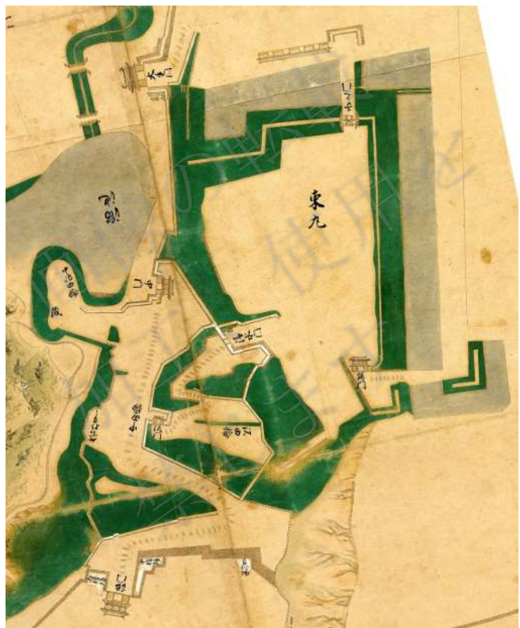
仙台城修復伺絵図 元文4年(1739) 仙台市博物館所蔵