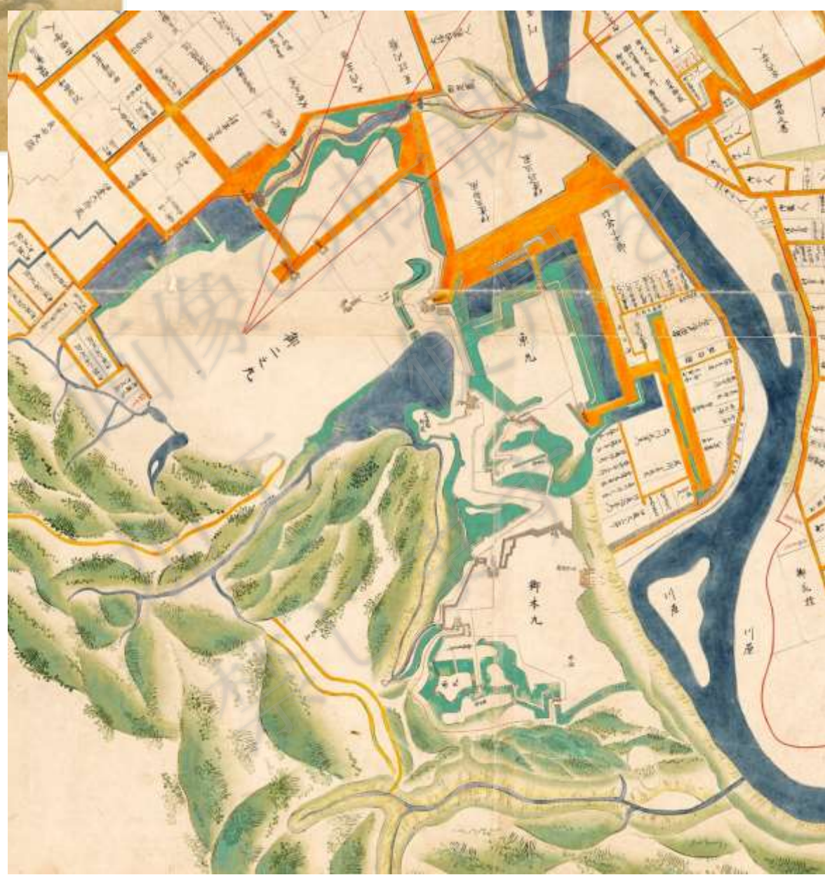
仙台城下絵図 寛政元年(1789) 仙台市博物館所蔵