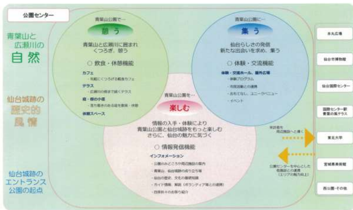
図 8-1 (仮称) 公園センターの機能展開図 (「青葉山公園(仮称)公園センター基本計画」平成 29 年 4 月より)