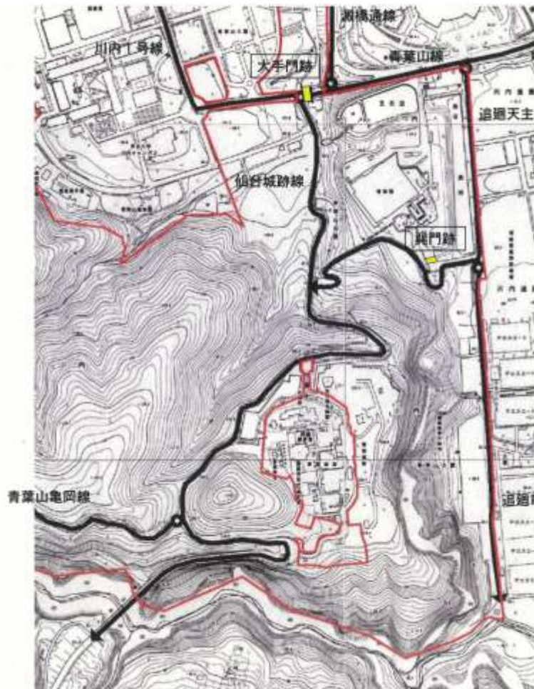
図 11-1 大手門跡の位置と市道