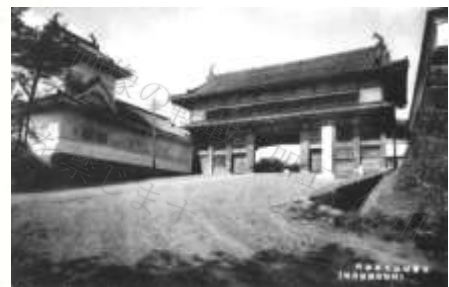
図 11-3 大手門の古写真