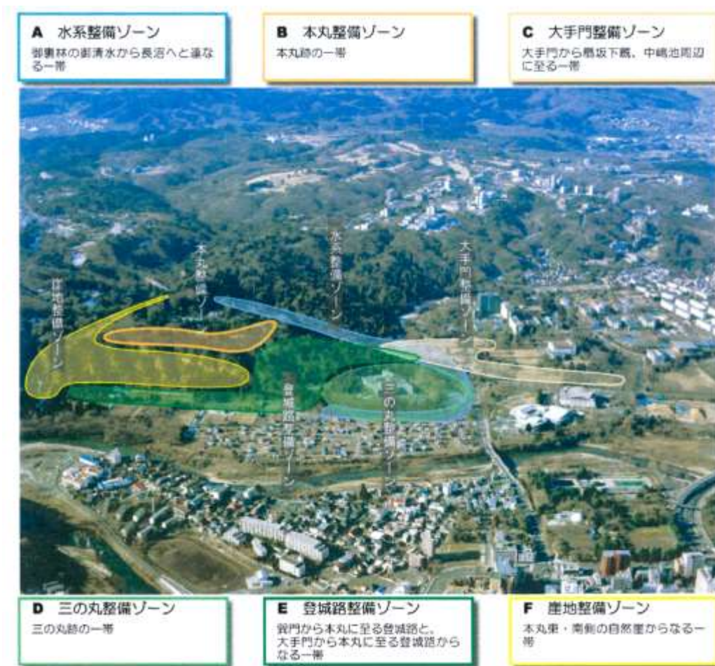
図 9-1 整備ゾーン概念図 (「仙台城跡整備基本計画」平成 17 年 3 月より)