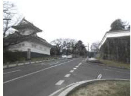
図 11-2 大手門跡の現況