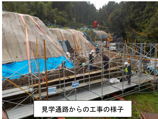
見学通路からの工事の様子