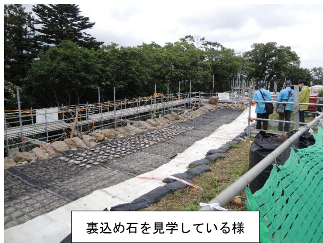
裏込め石を見学している様