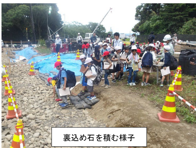
裏込め石を積む様子

概 要：通町小学校 3 年生の出前授業において、本丸北西石垣工事現場内を案内し、裏込め石を石垣内部に積む体験を実施した。