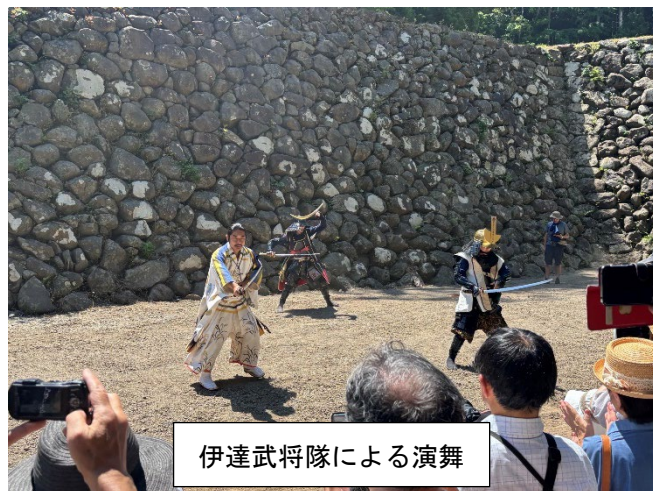
伊達武将隊による演舞