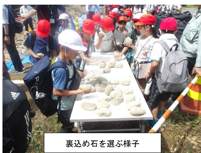
裏込め石を選ぶ様子