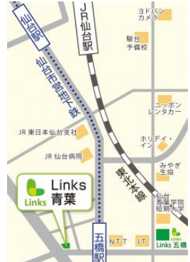
五橋駅(北2番出口)より徒歩