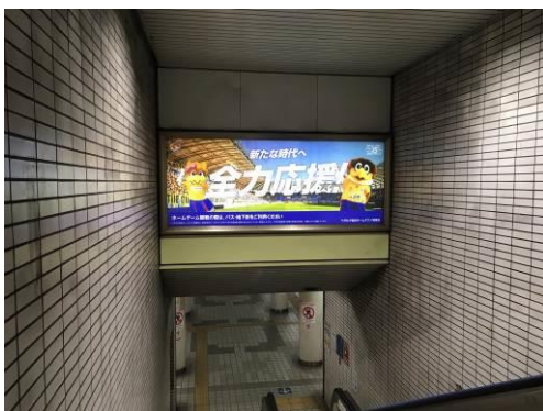
河原町駅階段正面