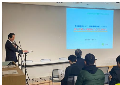
檜森区長による事業趣旨説明