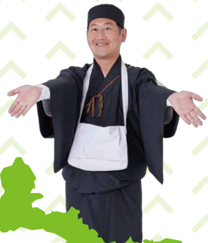
中田地区町内会連合会