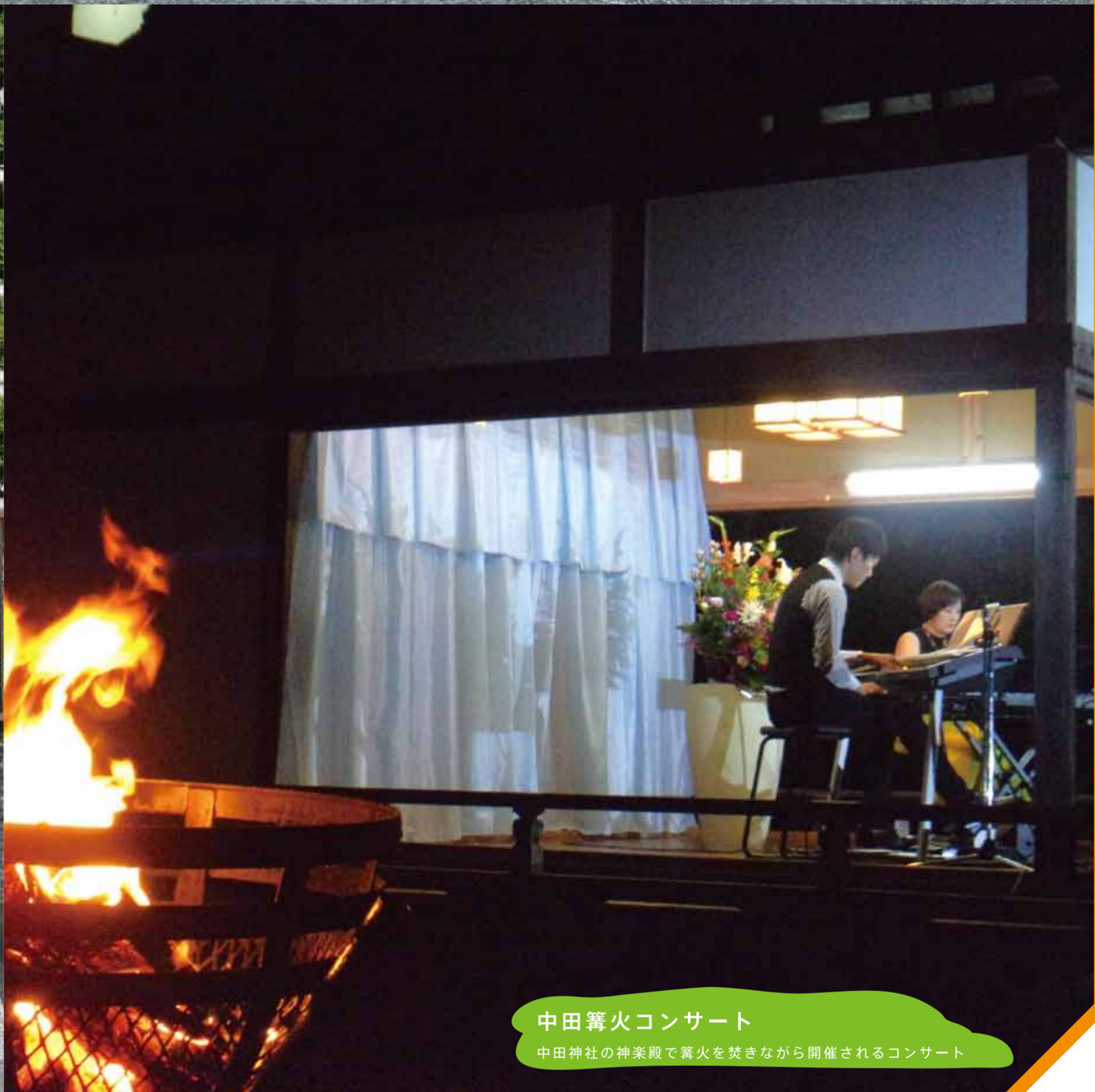
中田篝火コンサート