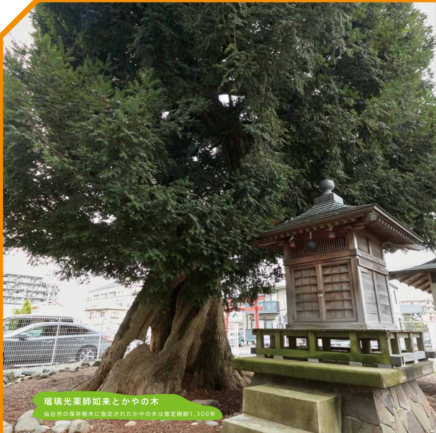
瑠璃光薬師如来とかやの木 仙台市の保存樹木に指定されたかやの木は推定樹齢1,300年