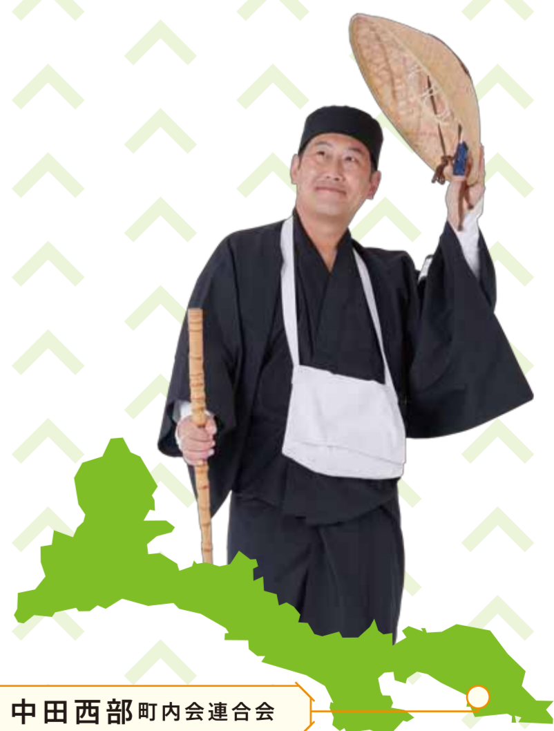
中田西部町内会連合会