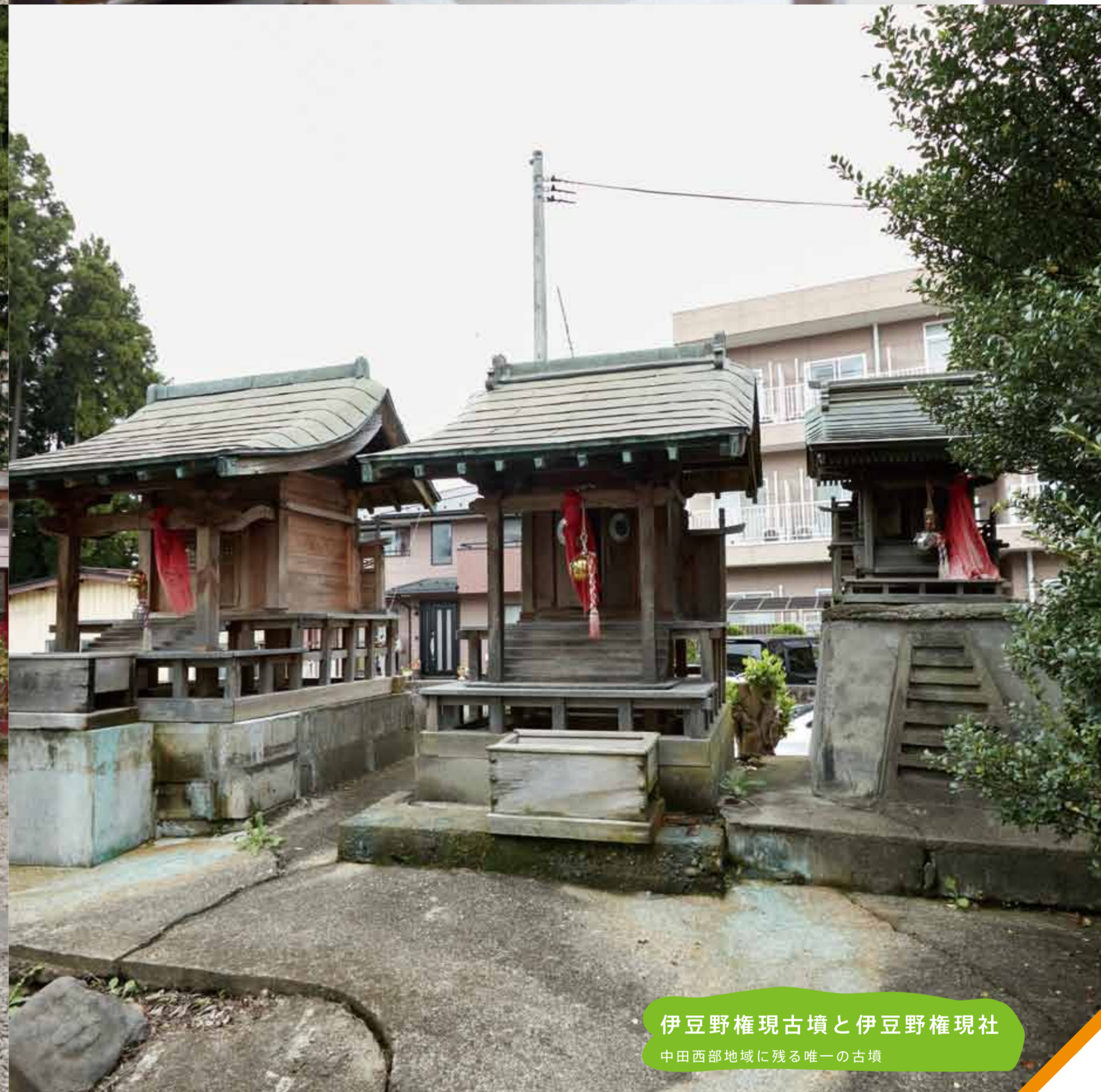
伊豆野権現古墳と伊豆野権現社 中田西部地域に残る唯一の古墳