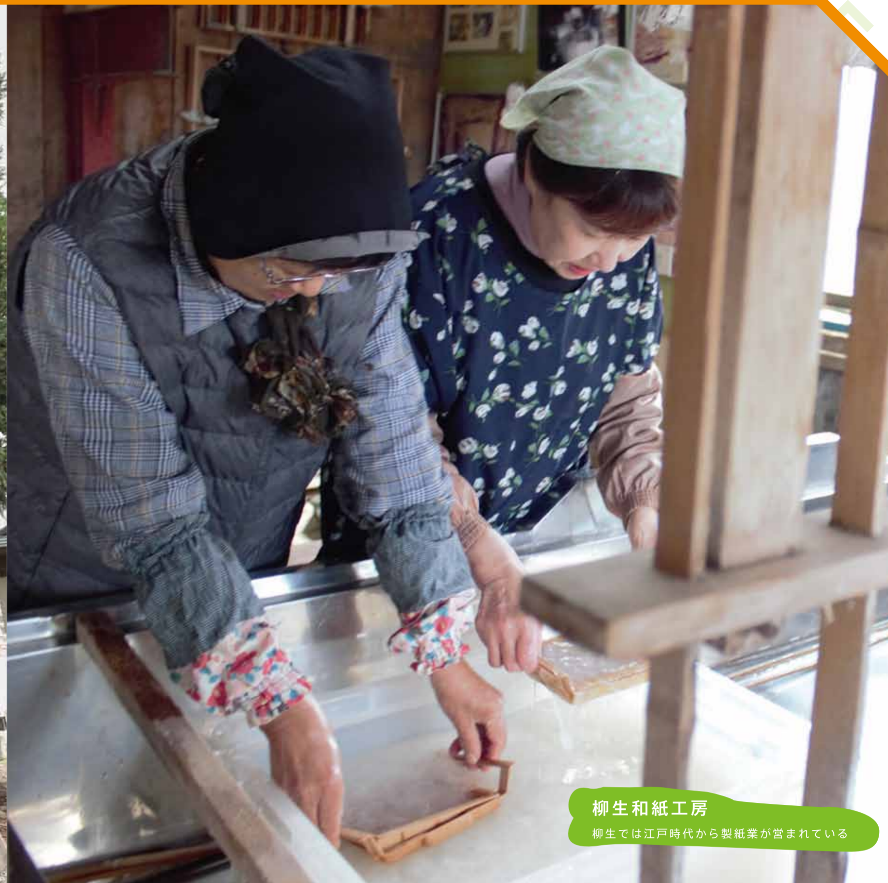
柳生和紙工房 柳生では江戸時代から製紙業が営まれている