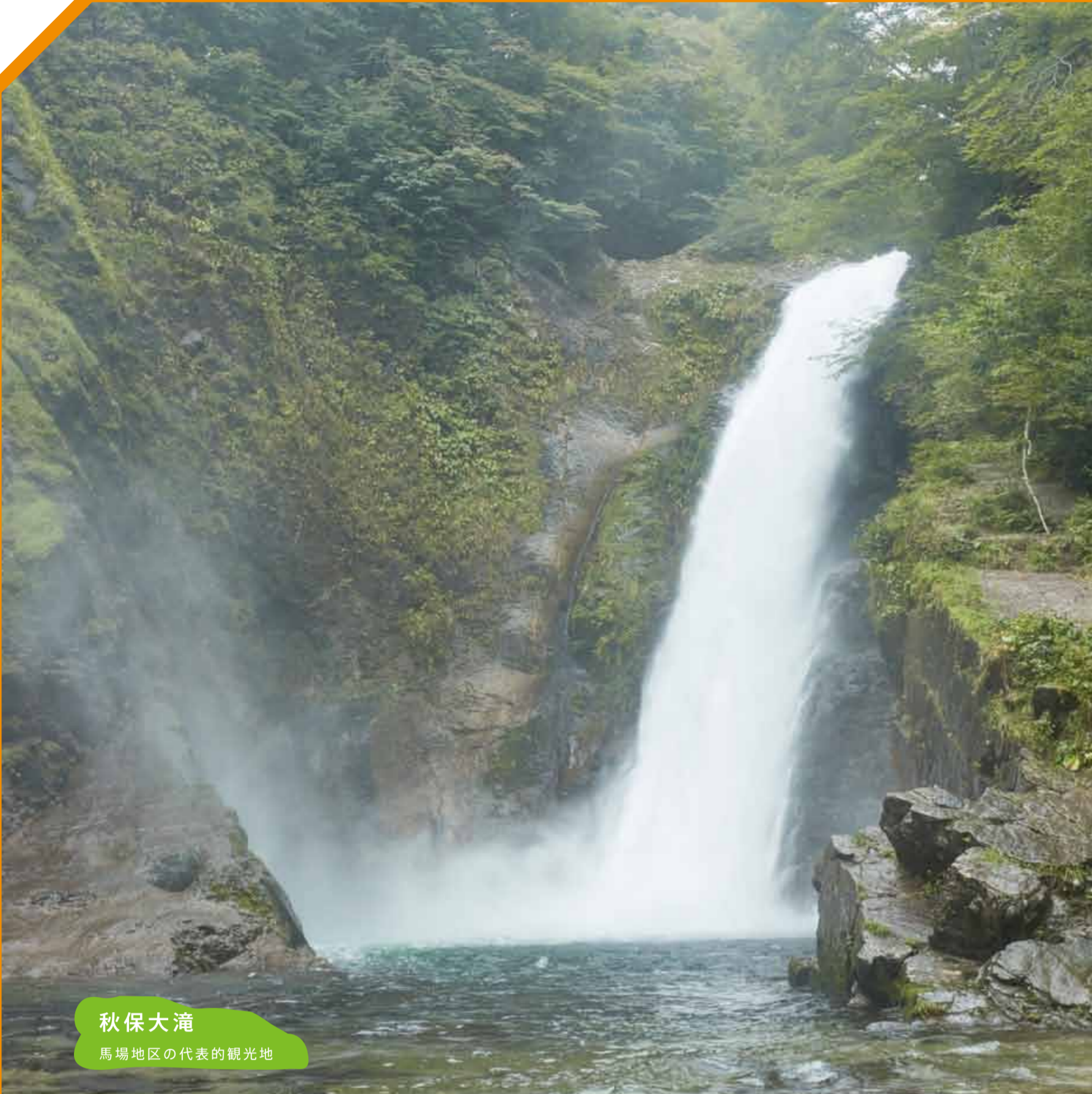
秋保大滝 馬場地区の代表的観光地