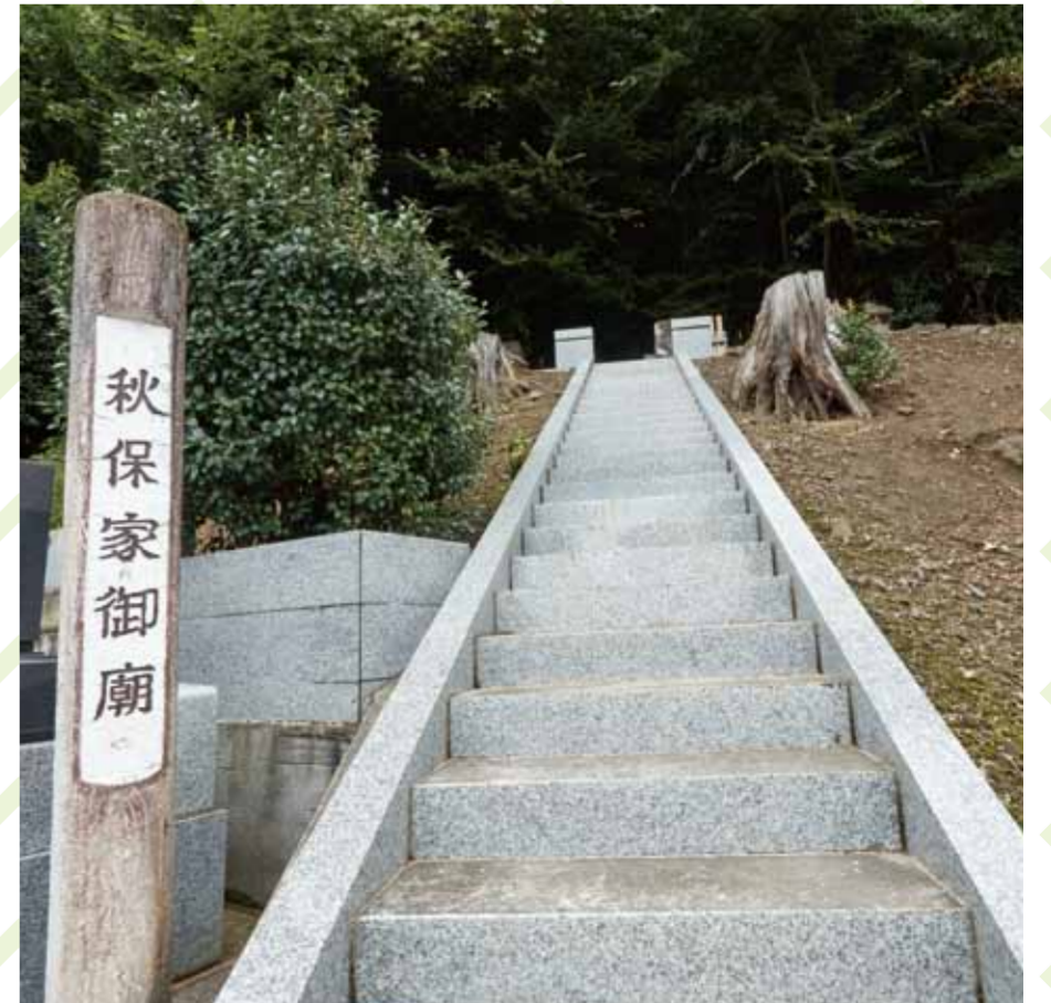
大雲寺秋保家御廟所:江戸時代の秋保家の墓