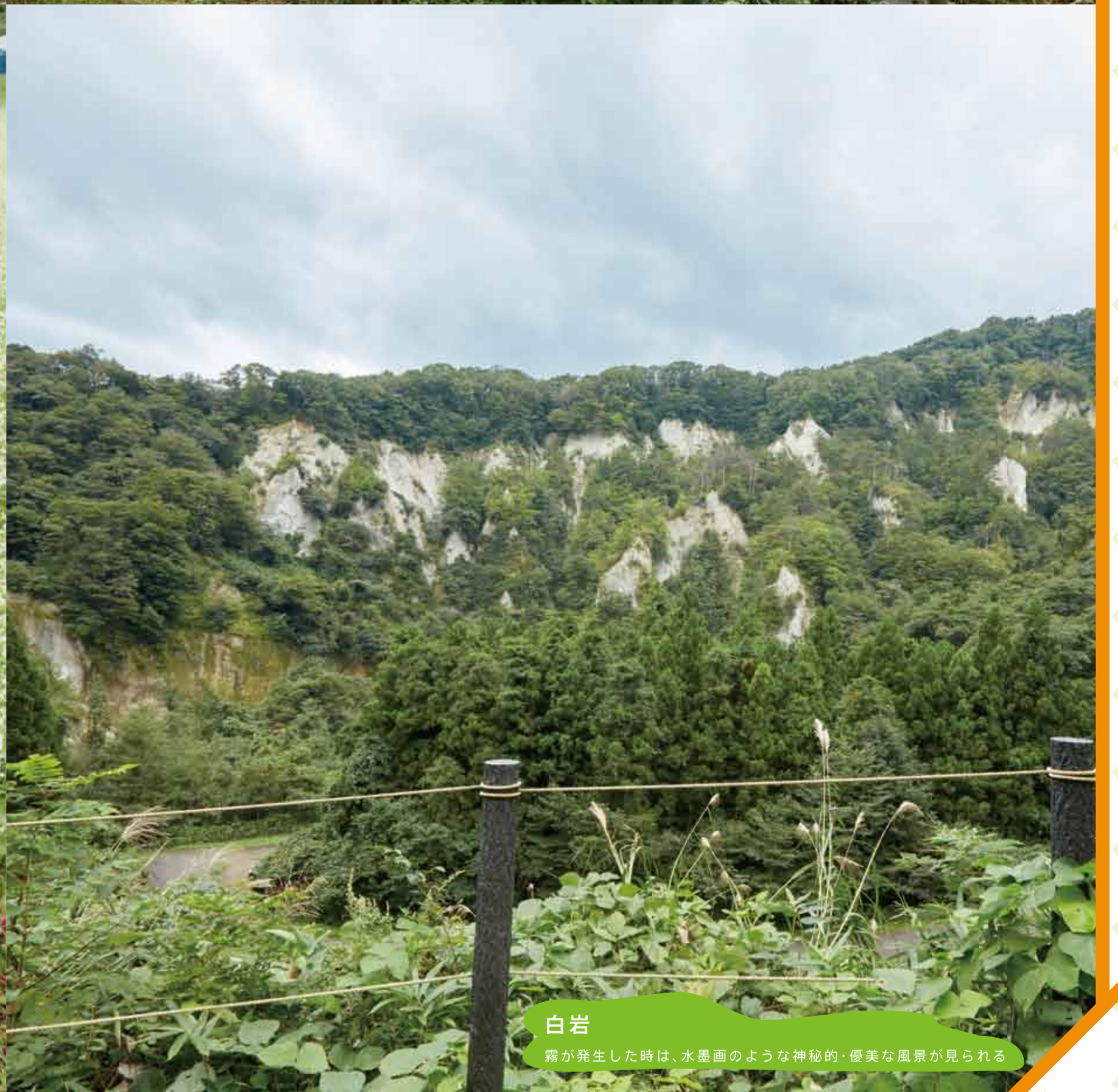
白岩 霧が発生した時は、水墨画のような神秘的・優美な風景が見られる