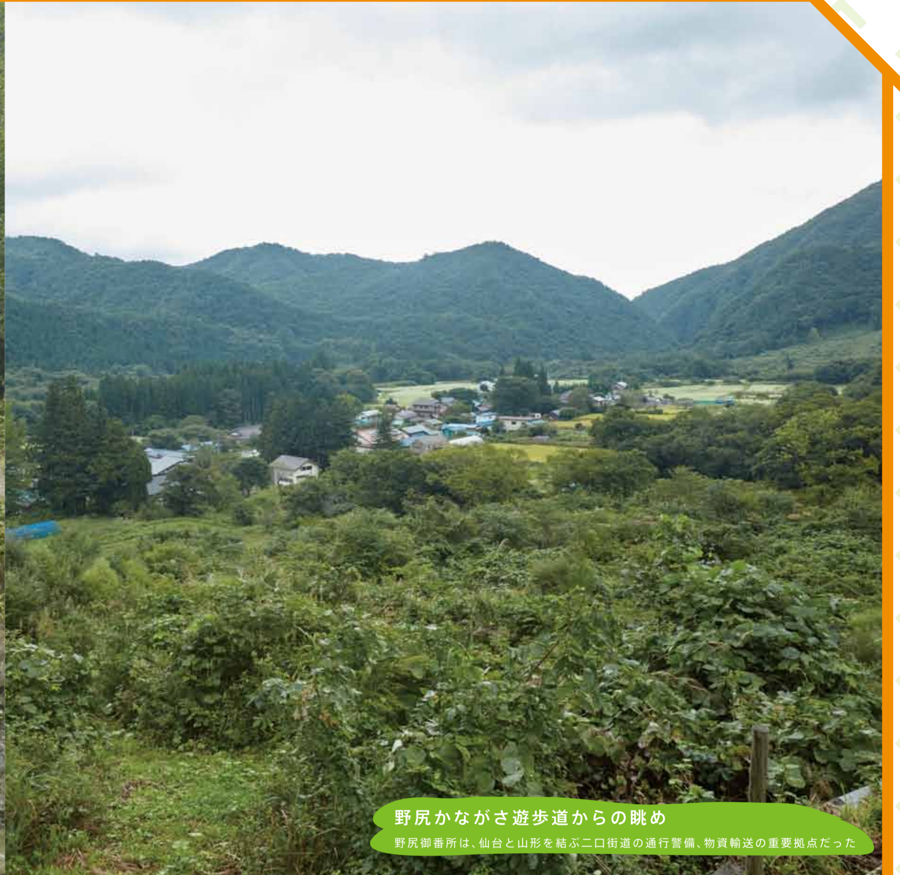
野尻かながさ遊歩道からの眺め 野尻御番所は、仙台と山形を結ぶ二口街道の通行警備、物資輸送の重要拠点だった