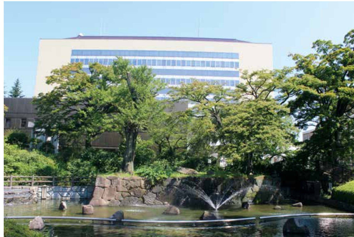
ふるさと広場(若林区役所南側)