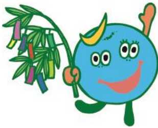
仙台市選挙 マスコット キャラクター 「てとりん」