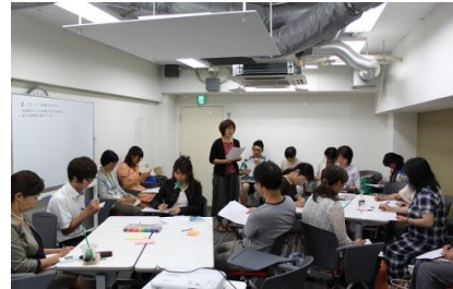
とうほくあきんどでざいん塾ワークショップ