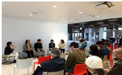
『せんだい3.11メモリアル交流館』における発表会の様子