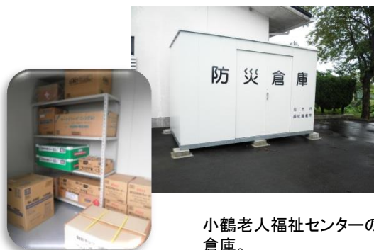
小鶴老人福祉センターの備蓄倉庫。

平成27年度は小鶴、大野田の各老人福祉センターに備蓄倉庫を設置しました。LPGインバータ発電機、LED投光器などが整備されました。