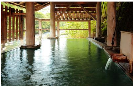
秋保・作並メディアプロモーション

閑散期特別プラン支援事業と連動して、仙台の奥座敷である「秋保温泉」と「作並温泉」をPRしました。