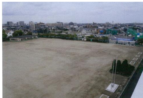
復旧整備後の蒲町小学校の校庭