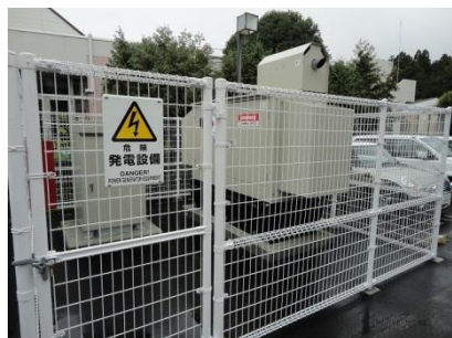
泉区の障害者福祉センターの自家発電設備の様子。

災害時に皆さまに安心して、ご利用していただくため、宮城野区、太白区、若林区に引き続き、泉区の障害者福祉センターに自家発電設備を設置いたしました。