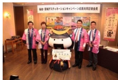
仙台・宮城デスティネーションキャンペーン

キャンペーンを盛り上げるため、中心部商店街にフラッグ及び横断幕の掲出を行いました。