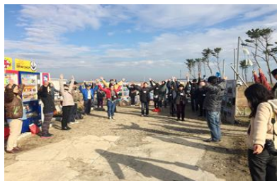
荒浜で開催した「3.11オモイデツアー」ゼミの様子