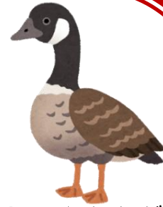
しじゅうからがん