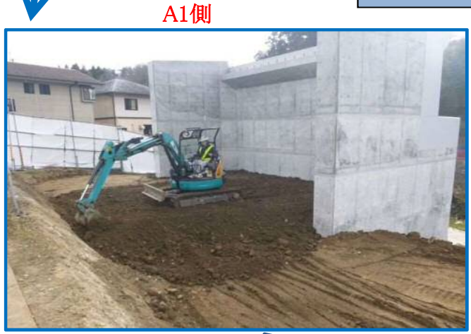
橋台の完成後、土の埋戻し作業中です。