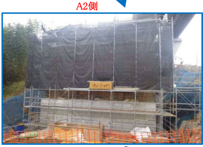
今後、橋台の足場解体作業に入ります。