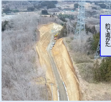
進捗写真 【南から北側を撮影】 (上空から撮影) R2.1.10