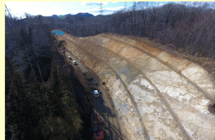
進捗写真 【北から南側を撮影】