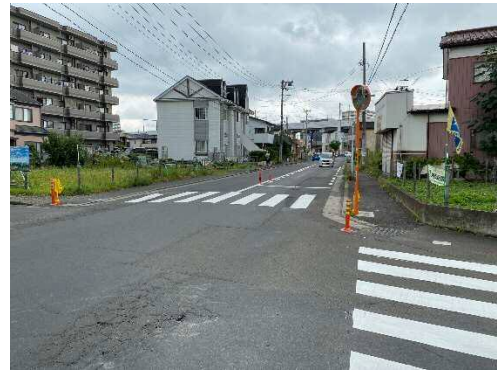
写真:工事後の状況②