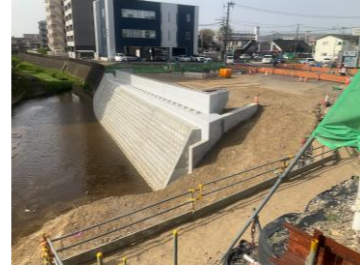
護岸新設(西側)完了