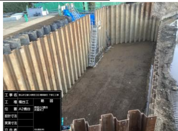
鋼矢板土留・掘削完了