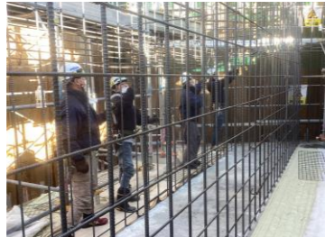
橋台の鉄筋組立状況