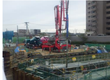
ポンプ車によるコンクリート打設状況