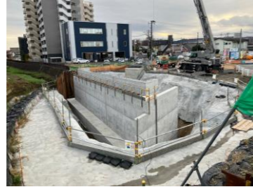
橋台新設(西側)完了