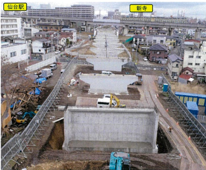
完成した橋脚 (3月23日)

地域の皆様には、日ごろより仙台市の行政運営にご理解、ご協力を頂き感謝申し上げます。9月より着手しました下部工工事におきましては、おかげさまで3月末日にて完成となります。地域住民の皆様方には御協力いただきまして本当にありがとうございました。今後の工事につきましては、平成30年度に県道北側において橋の上部工工事を予定しております。また、今後も本工事だよりを2ヶ月に1回程度発行してまいりますので、引き続きご愛読願えればと存じます。