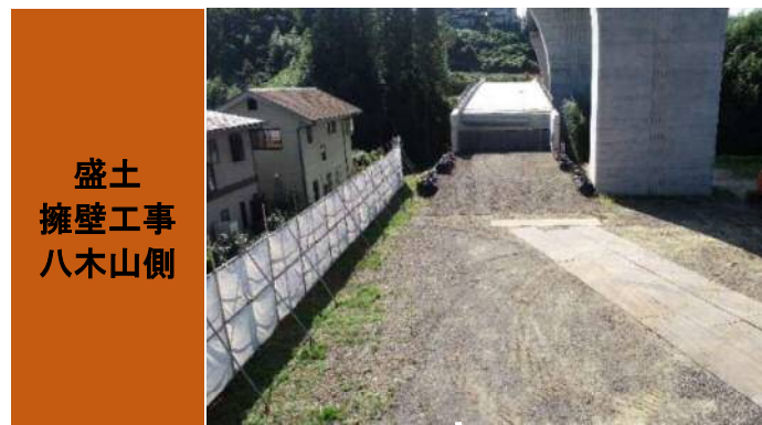
① R1.10.10 八木山からひより台に向け撮影