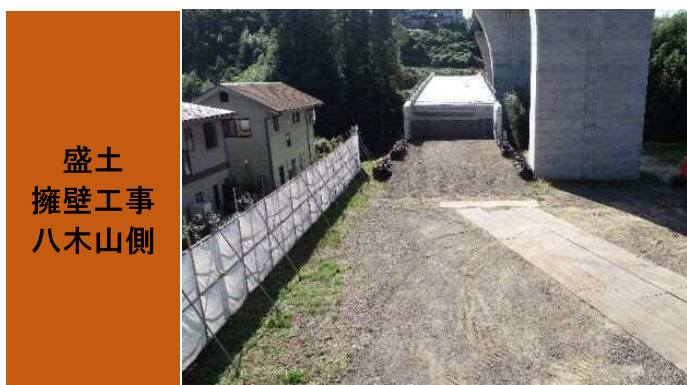
① R1.10.10 八木山からひより台に向け撮影